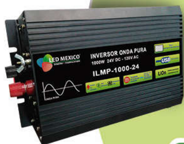
Para Baterías Litio Ion Inversor ILMP